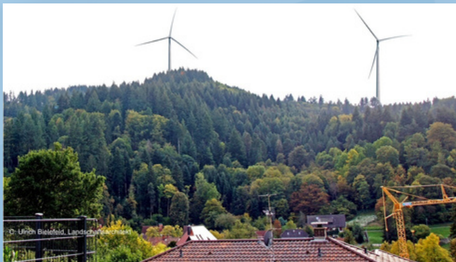
Künftiger Blick von Günterstal auf den Illenberg